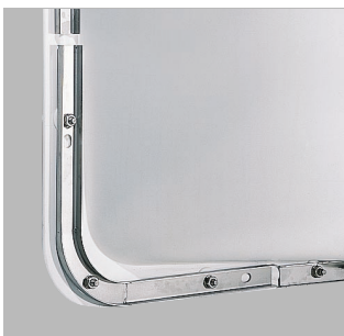
Druckwasserdicht montierter ACO Lichtschacht