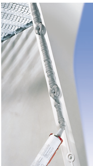
Aufbringen von ACO Profix