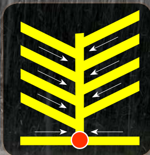
Verlegeraster auf Grundstücken < 300 m 2