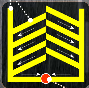
Verlegeraster auf Grundstücken > 300 m 2